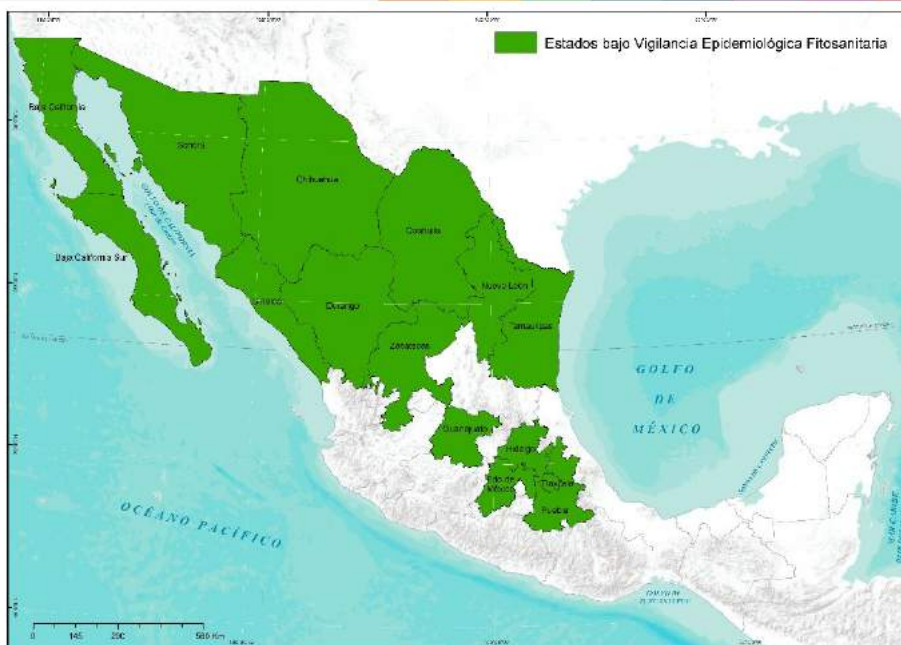
Figura 2. Vigilancia Epidemiológica Fitosanitaria de Puccinia graminis f. sp. tritici raza Ug99. Elaboración propia con datos de SADER-SENASICA-PVEF, 2019b.